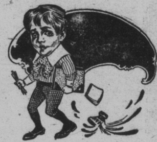
UNE GROSSE BAISSE DANS

R. B. Hanson Soliciteur pour applicants.