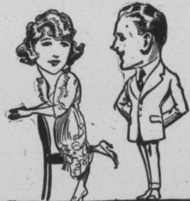
POUR PLAIRE AUX DAMES

achetez vos habits chez Jos David et vous serez toujours certain de votre coup. Les femmes ont un bon goût, et elles apprennent votre belle apparence. Nos modes sont approuvées par elles.