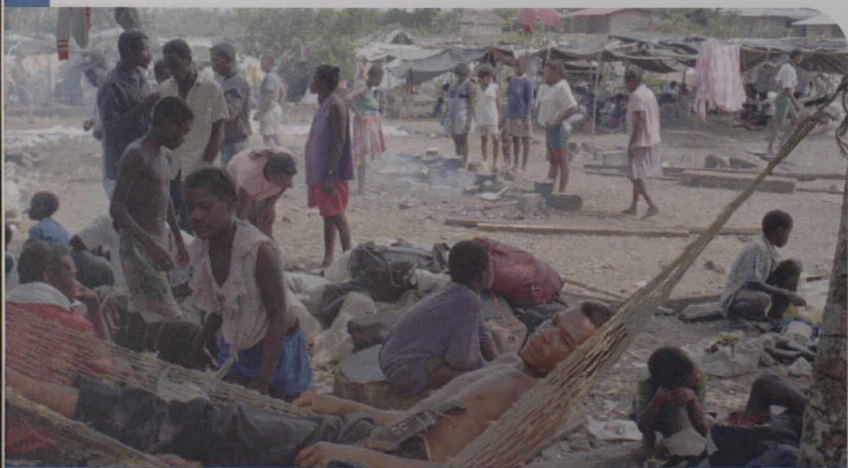
Le camp de réfugiés de Pavarando, environ 800 kilomètres au nord de Bogotá, en Colombie. Des milliers de paysans se sont réfugiés là pour échapper à la violence entre la guérilla de gauche, les paramilitaires de l'extrême-droite et l'armée.

Les dirigeants de l'hémisphère savent que les élections ne sont que le début du renforcement de la démocratie, et que de nombreux