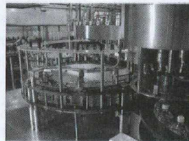
Un secteur du marché : la mise en bouteilles de l'eau.

aliments de grande qualité. Les fabricants locaux de ce type d'équipement ne pouvaient pas répondre à la demande accrue et la qualité de l'équipement de production nationale ne satisfait pas aux critères modernes fondés sur des technologies de pointe, bien que leur équipement soit très compétitif sur le plan des prix.