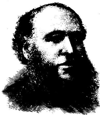
LE MILLIONNAIRE VANDERBILT DÉCÉDÉ À NEW-YORK