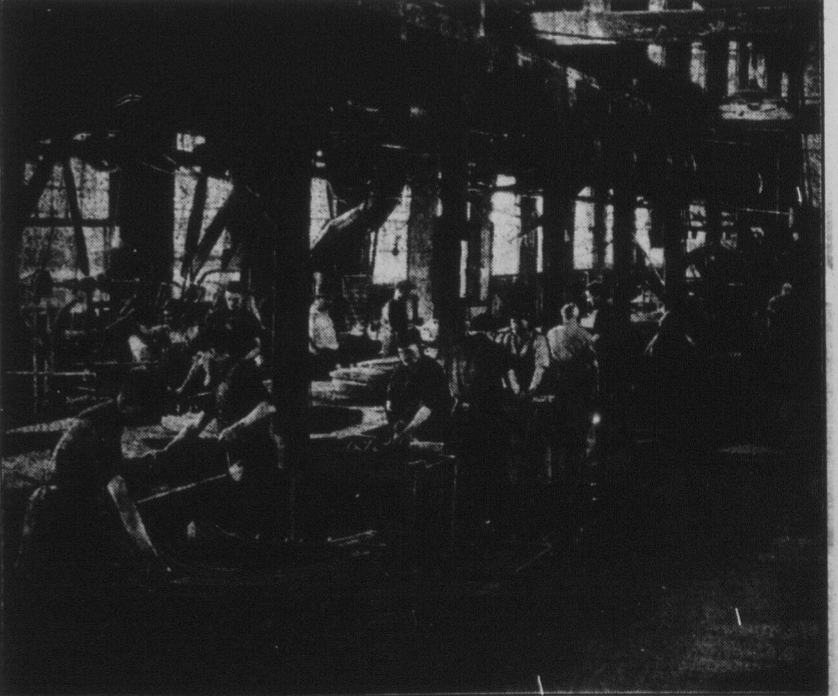
photo shows workmen assembling Ford springs on a moving conveyor, lubricating the spring leaves, painting the assembled bumpers and inspecting the finished product. The Chatham plant employs 125 men and is one of many factories in many parts of Canada producing materials and supplies for Ford cars and trucks.

Indicative of the increased employment in many Canadian cities resulting from the present volume production of Ford V-8 and 4-cylinder cars is the factory of the Ontario Steel Products Company, Limited, at Chatham, Ontario, which is engaged in the manufacture of Ford chassis springs and bumpers. The