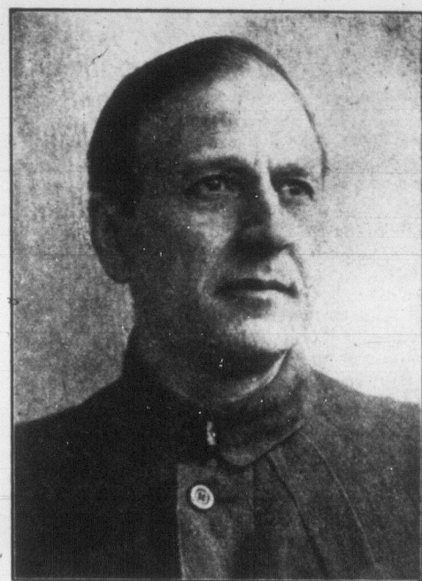
Х. Ю. РАКОВСЬКИЙ Голова Ради Народних Комісарів України. (Найновіша фотографія.)