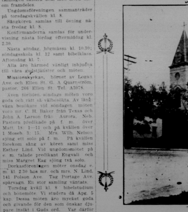
Svenska Luth. Zionkyrkan i Winnipeg.