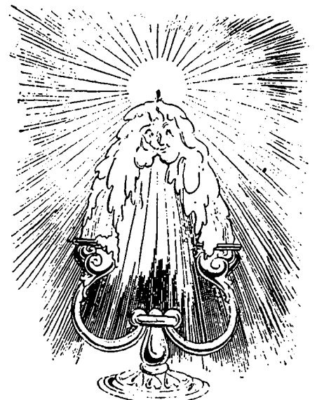
III. — MARIAGE

Evoluer n'est pas changer.—F. BRUNETIÈRE