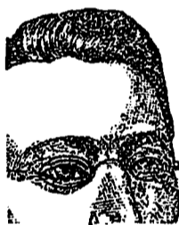
Le Dr Ricord

La veuve invita le médecin mont-réalais à déjeuner.