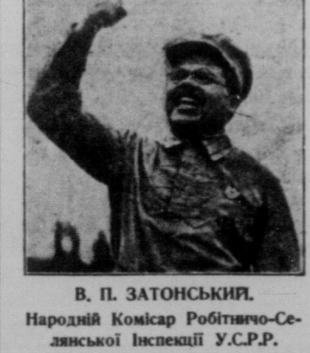
В. П. ЗАТОНСЬКИЙ. Народий Комісар Робітничо-Селянської Інспекції УСРР.

На недавньому пленумі ЦК. Компарті України т. В. Затонського вибрано головою Центральної Контрольної Комісії Компарті, а пізніше ВУЦВК признав т. Затонського на Народного Комісаря Робітничо-Селянської Інспекції. 1913 року т. Затонського запрошено на катедру фізики до Київського Політехнічного Інституту. Проте недовго залишався тов. Затонський серед педагогів вищої школи. Бувши з 1905 року в організації РСДРП, т. Затонський перед лютевою революцією вступає до партії більшовиків і цілком віддається революційній роботі. За царату т. Затонського кілька разів арештували: підчас Жовтневих революцій він бере активну участь у революційних подіях: його висувують на відповідальні пости. В листопаді 1917 року т. Затонського вибрано до складу першого радянського уряду України, як народного секретаря в справах освіти. В січні 1918 року, тов. Затонський, як член Раднаркму РСФРР, бере участь у виданню декрету про організацію Червоної армії. 1918 року він стоїть на чолі повстанських частин, що боролися проти Скоропадського й Петлюри. Цього-ж 1918 року тов. Затонський входить до складу уряду УСРР, як нарком освіти. 1919 року тов. Затонський у складі Всеукраїнського Ревкому, і тут він бере активну участь у військовій боротьбі проти Денікіна, як член Реввійськради XII. армії.