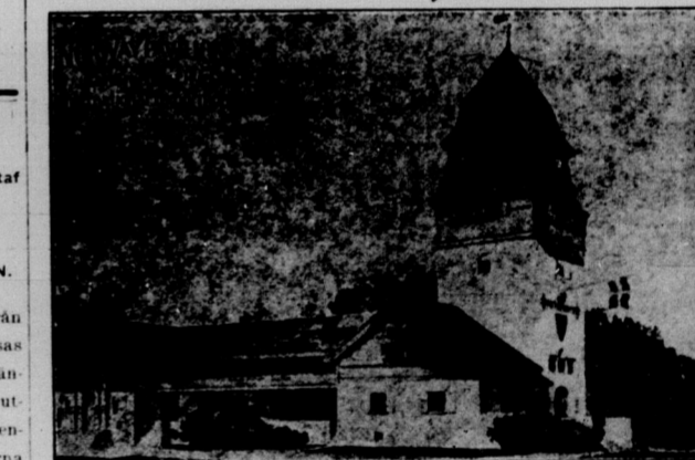
Norges byggnad på världsutställningen.