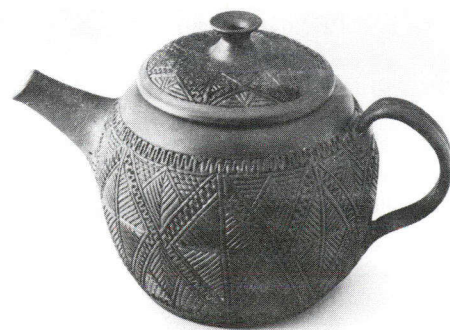
Théière en céramique (Mohawk)

Selon M. Tom Hill, cette exposition a pour but de révéler au monde entier la richesse de l'art indien.