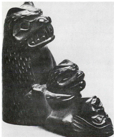
Naissance d'un ourson (Haïda)

Y figure également une magnifique collection de masques employés au cours des cérémonies rituelles, avant la