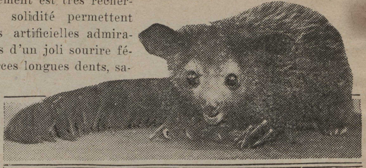
L'äi-äi est un grand faiseur de grimaces; cela ne l'empêche pas d'être fort gracieux.

se roule en boule, il n'offre alors aucune prise à son ennemi mais il a encore un meilleur moyen de défense: c'est de s'enterrer. Il creuse la terre avec tant de facilité que deux hommes creusant derrière lui pour le rejoindre ne peuvent y parvenir.