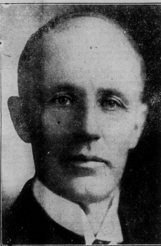
LE TRES HONORABLE ARTHUR MEIGHEN