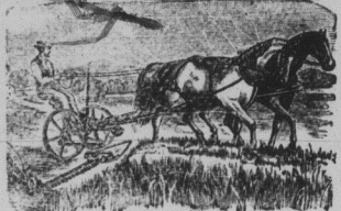
Feuilleton Agricole Le diable est aux vaches Cas de Sorcellerie