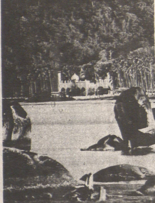
神奇之島——浮羅交怡一角。