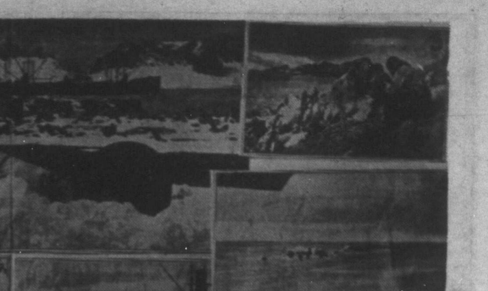
A legújabb sarki-expedíció nem sokára el fogja érni Wilkins fent bemutatott két év előtti táborozásának színhelyét, miután már a múlt hét közepén elhagyták Skjerveo norvég kikötőt, ahol a tengeraltjárón elvégezték a szükséges javításokat.