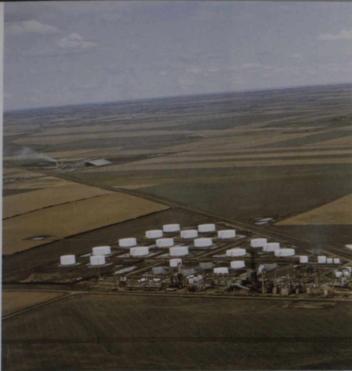
Boven: Olieraffinaderij temidden van het uitgestrekte prairielandschap even buiten Regina, Saskatchewan.