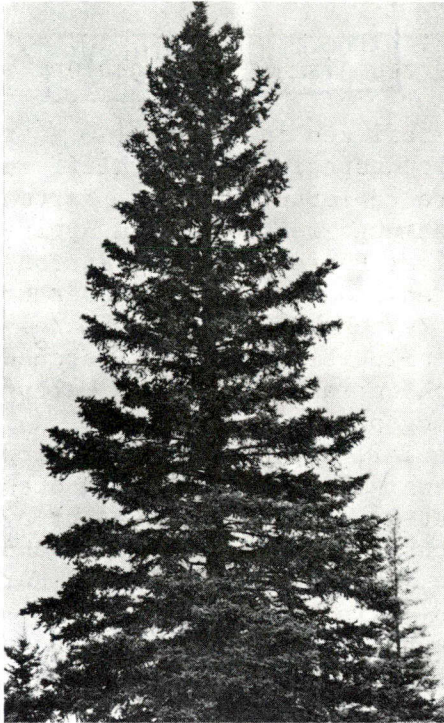
Die Weißtanne - Kanadas Hauptlieferant von Fasern für die Papiererzeugung

Lumpen als Ausgangsmaterial benutzt, die manuell zu Einschlag- und Druckpapieren verarbeitet wurden. Das erste maschinell hergestellte Papier in Kanada wurde in einer 1826 bei Toronto errichteten Papierfabrik erzeugt. Im ganzen 19. Jahrhundert stieg die Nachfrage nach Papier ungeheuerlich an, während die zu seiner Herstellung erforderlichen Lumpen immer knapper wurden. Als um die Mitte des 19. Jahrhunderts ein Verfahren zur Herstellung von Papier aus Holz entwickelt wurde, bedeutete das eine umwälzende Neuerung für diesen Industriezweig.