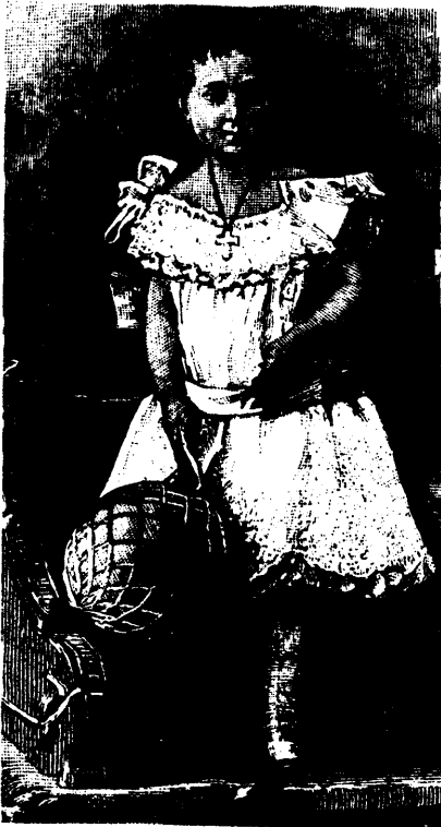
MARIA DE LAS MERCEDES Héritière présomptive à la couronne d'Espagne