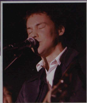
▲ Le rocker Kris Demeanor, de Calgary.

▲ Plus dans le coup qu'on ne le croit : La musique canadienne d'avant-garde est bien reçue dans la région, où on la diffuse dans les boîtes de nuit et les magasins.