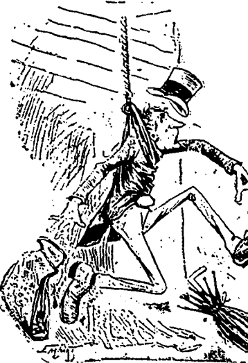
L'étranger se sent enlevé et pousse des cris de détresse.

Pendant qu'il regarde, des gamins font fonctionner la manivelle de la grue.