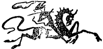
Le chébra de file, professeur d'Équitation