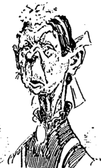
II Le type qu'elle recherche maintenant.