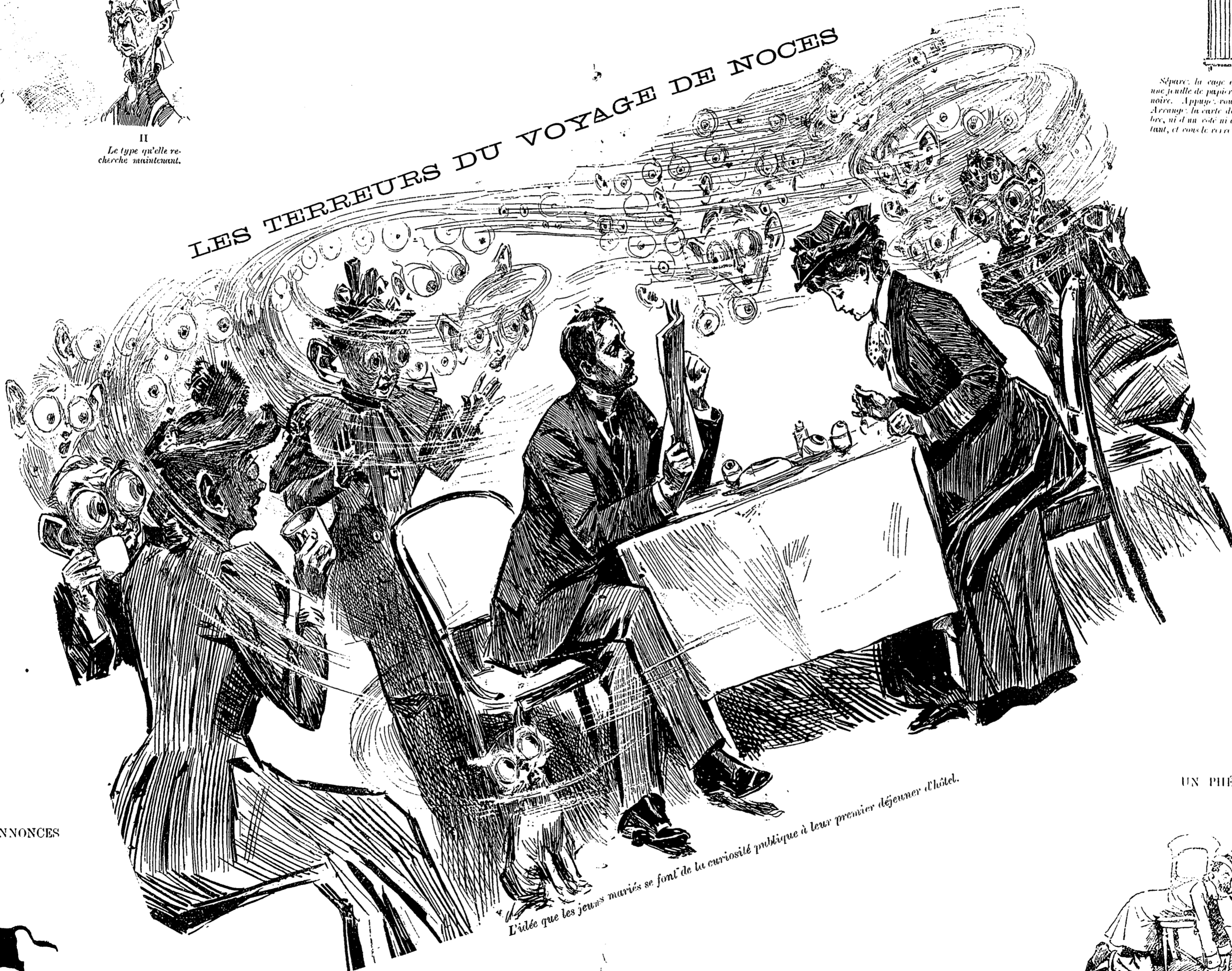
L'idée que les jeunes mariés se font de la curiosité publique à leur premier déjeuner d'hôtel.