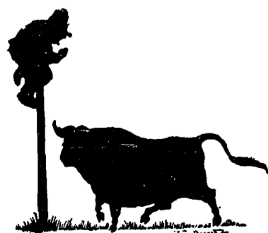
Un monsieur qui a de hautes relations en rapport avec le bétail demande un changement de situation pour raisons de santé. S'adresse à P. D. Q.