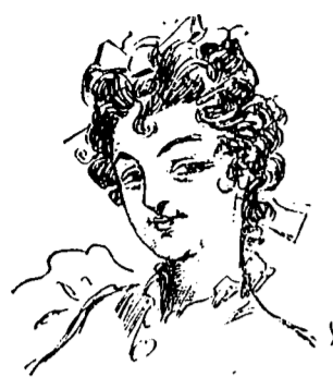
I Le type de servantes que madame Lavoisier engageait dans les premiers temps de son ménage.