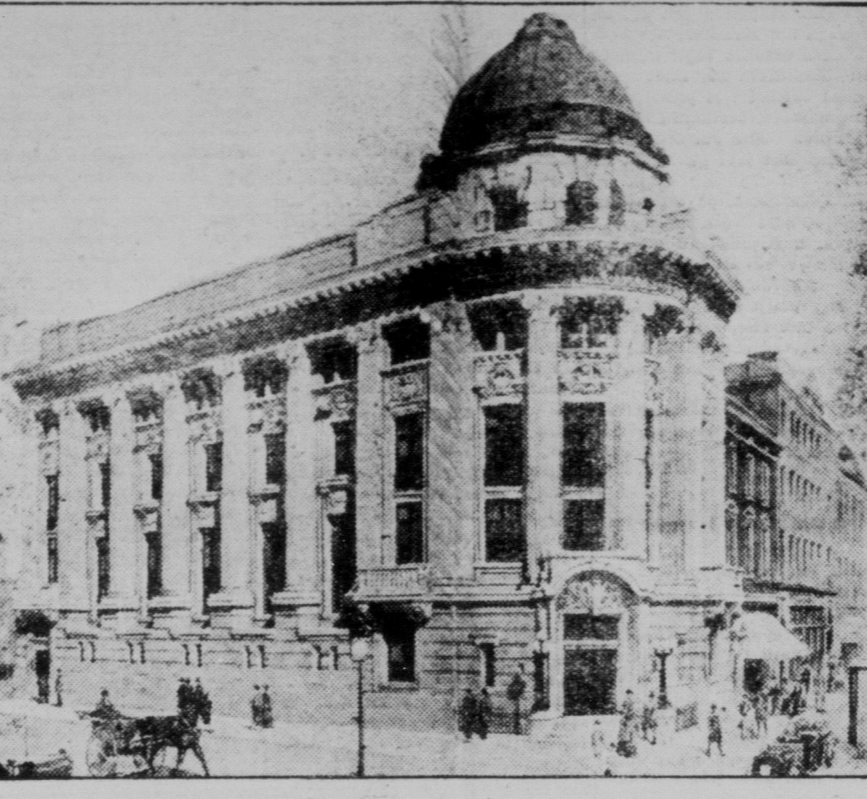
BANK OF NOVA SCOTIA, PORTAGE AVE. OCH GARRY ST.

Byggnadsverksamheten i Winnipeg detta år blir efter alla tecken en domäns betydligt. Ett stort antal större och mindre byggnader hålla på att uppföras och ett enda större antal sådana äro planerade. Bland dem, som rasat några sig fullbordad, är Nova Scotia bank-byggnaden. Ovanstående ger en bild af huru den kommer att se sig, då den blir färdig. Som synes är stilen ovanligt