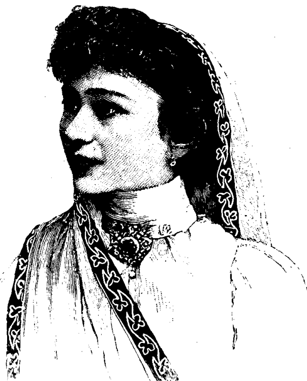
Une jeune femme Parsie