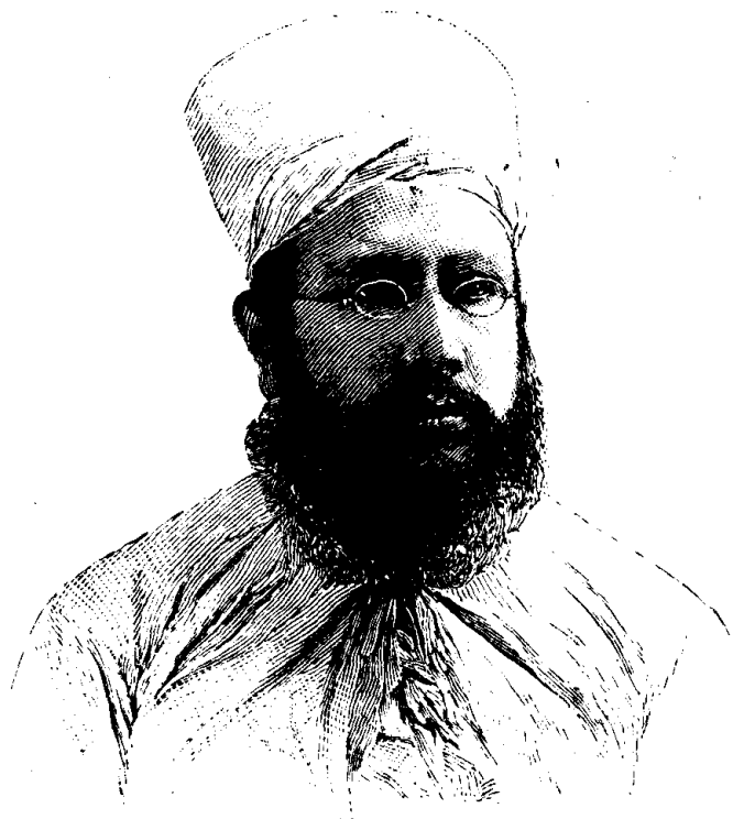
Un prêtre Parsi

La ligne, par insertion - - - - 10 cents Insertions subséquentes - - - - 5 cents Tarif spécial pour annonces à long terme