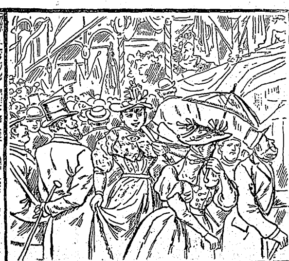
Une assemblée publique. Trouvez l'orateur.