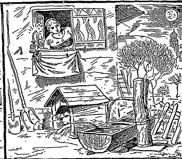
La belle entend son cavalier. Trouvez-le.