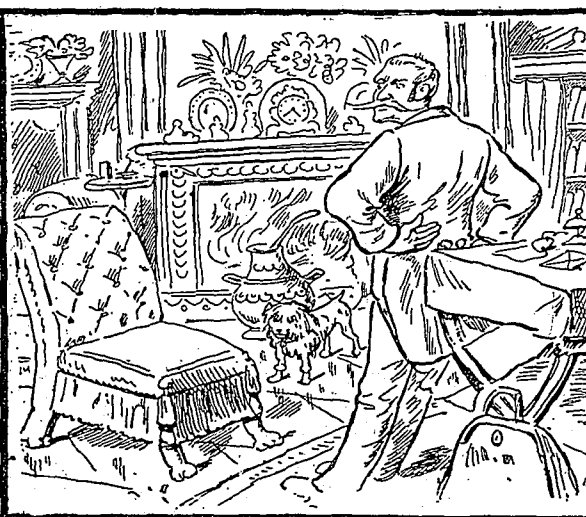
Monsieur appelle son valet. Où est-il ?