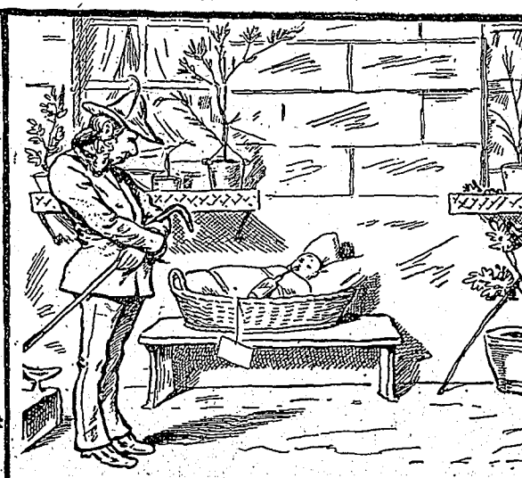
Un enfant-trouvé. Cherchez la mère.