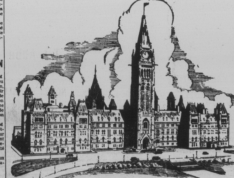
Cette vignette représente l'édifice du Parlement canadien à Ottawa où a lieu aujourd'hui l'ouverture de la conférence, économique impériale qui réunit de nombreux délégués de tous les pays composant l'empire britannique.