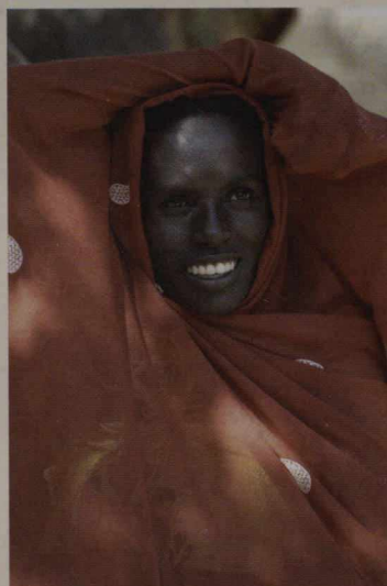
Le camp pour personnes déplacées de Zam Zam, dans le Nord du Darfour, au Soudan

On trouvera les photographies de l'ambassadeur Fowler au site www.robertfowler.com .