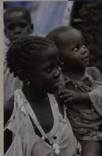
Le camp pour personnes déplacées de Bunia, dans la province d'Ituri, en République démocratique du Congo