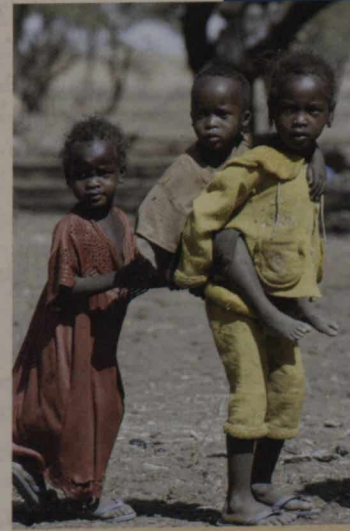
Le camp pour personnes déplacées de Zam Zam, dans le Nord du Darfour, au Soudan