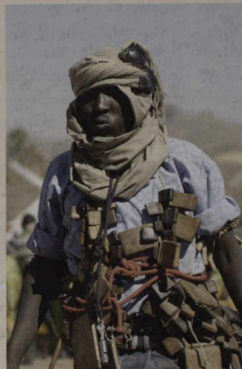
Jabel Marra, dans le Sud du Darfour, au Soudan