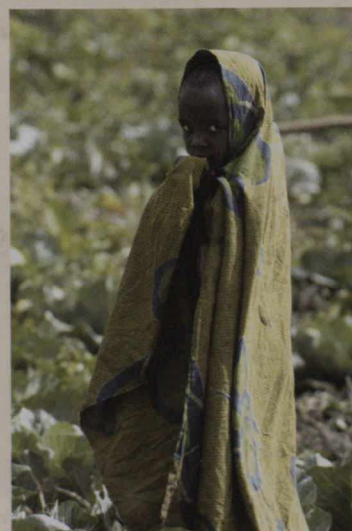
L'initiative « travail contre nourriture » du Programme alimentaire mondial, près de Kibungu, au Rwanda