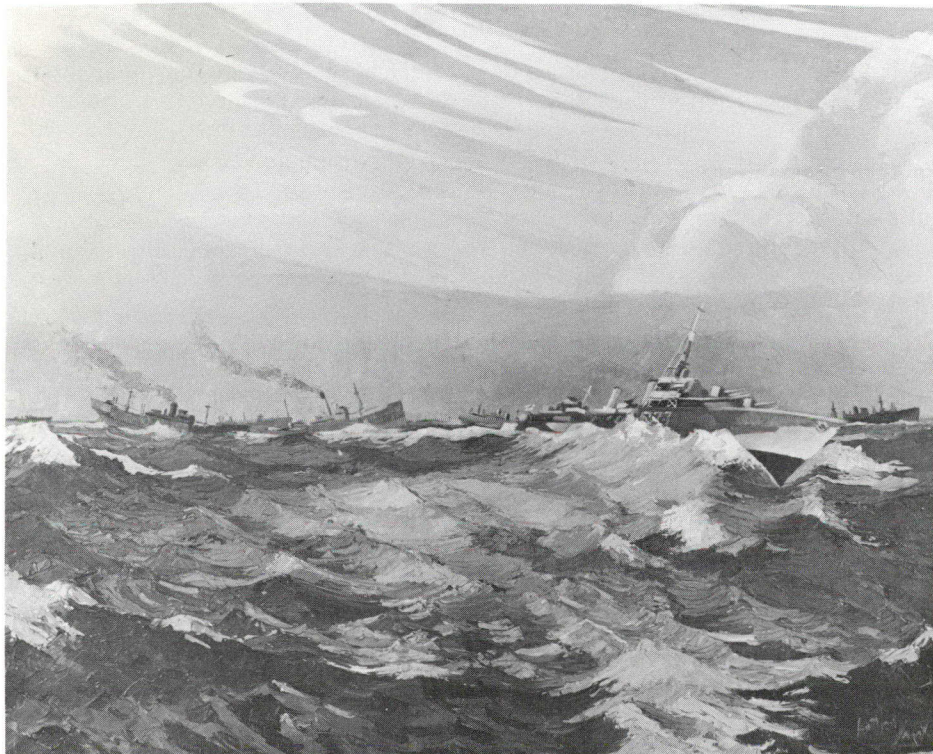
Canadiens à bord d'un convoi septentrional, par Charles Anthony Law, 1916-

La première fois qu'on a eu recours sur une large échelle à des réservistes de la Marine au Canada remonte probablement à 1745, au moment de la première prise de Louisbourg; à cette occasion, on avait utilisé 90 navires de transport et dix navires d'escorte de la Marine royale dont les équipages comprenaient 1,000 marins volontaires. Depuis lors, les réserves ont joué un important rôle dans la défense navale du Canada. En 1947, la Marine canadienne avait décliné et ne comptait plus que dix navires et moins de 10,000 hommes. Toutefois, grâce à la participation du Canada à l'Organisation des Nations Unies et à l'Organisation du Traité de l'Atlantique Nord, la Marine royale du Canada (MRC) et la nouvelle Réserve de la MRC ont repris de l'importance. La