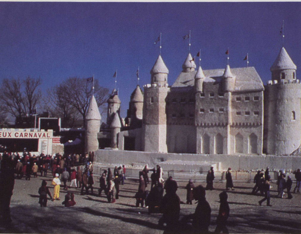
L'une des principales attractions du Carnaval de Québec, le somptueux Palais de neige.

Lorsqu'on mit sur pied le premier Carnaval de Québec en 1954, une nouvelle industrie touristique voyait le jour. Sa vocation : favoriser le tourisme hivernal et animer la Vieille Capitale. Trente-deux années plus tard, les réjouissances sont toujours dirigées par le joyeux Bonhomme Carnaval accompagné de sa cour, la reine et les duchesses.