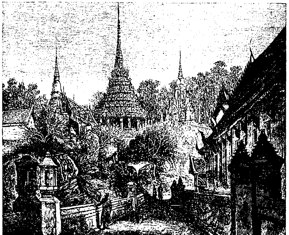
LE PALAIS PRINCIPAL DU ROI À BANGKOK.

Prière d'adresser toutes les Correspondances à G. VEKEMAN, B. P.—2177.