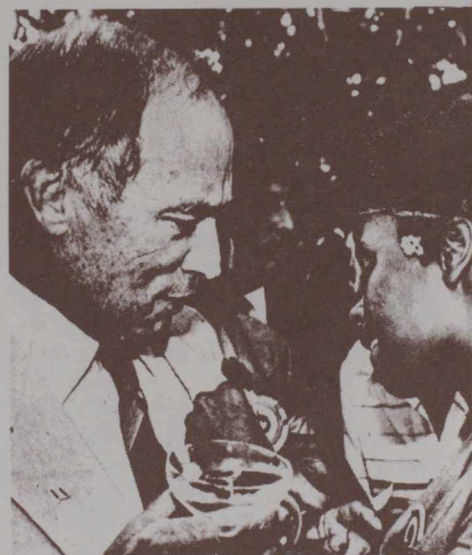
● Une jeune participante accroche un macaron à la boutonnière du Premier ministre Trudeau.

A la veille de la clôture, les 400 jeunes délégués présents ont présenté des résolutions couvrant des sujets aussi