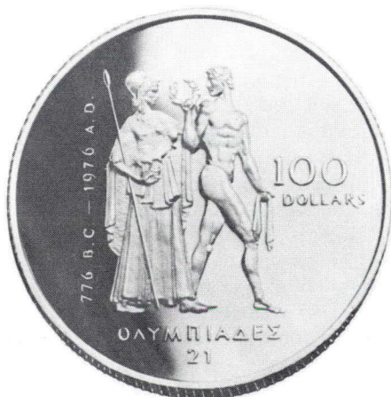
La pièce d'or des Jeux olympiques (voir article de la page 5)