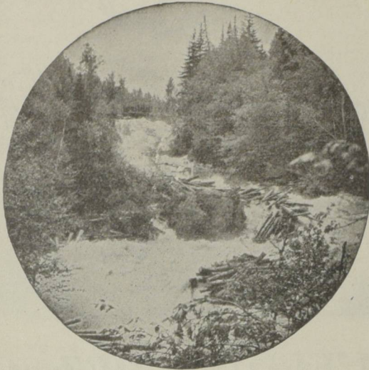
Et l'art, ornant depuis sa simple architecture Par ses travaux hardis surpasse la nature. (BOILEAU)