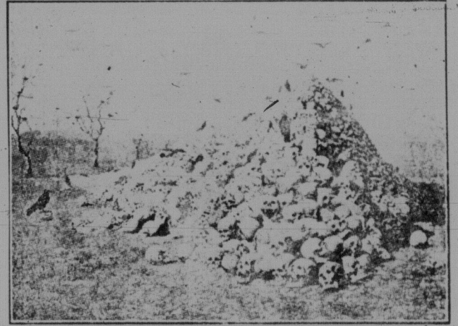
Що приносить людству війна.

В Парижі опублікувало відозву французької компартії, що закликає трудящі маси Франції готуватися до міжнародного анти-імперіалістичного дня 1-го серпня. 1-ше серпня, говориться у відозві, має стати днем об'єднання страйкових вибухів, днем ширшої страйкової демонстрації. Страйкерим робітникам протистоят об'єднані сили підприємців, уряд, соціалістичної партії й реформістської конфедерації праці. Відмовляючись збільшити заробітну плату, капіталісти водночас витрачають мільярди на готування війни. Про це найкраще