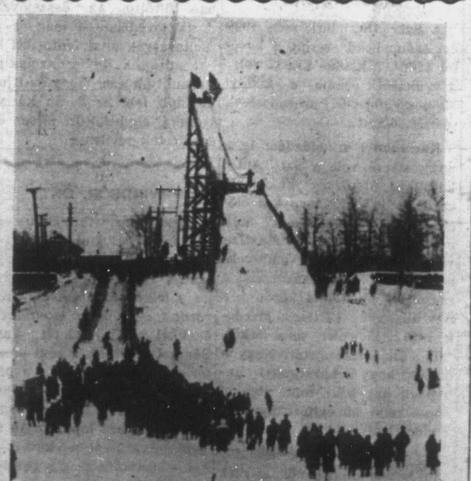
Esik a hó, csuszik a szán... Az idej enyhe kanadai tél még a kevésbé bátrakat is kicsalja és a városok népe nagy tömegben keresi fel az ilyen csuszdákat, melyeken nagy sebességgel rohan lefelé a "ski" nevű "lábszánkó".

A kölcsönbe való szállítás pedig nem vált be a gyakorlatban. Hiszen még ma is hatalmas ürt jelent az államkincstár az utolsó napján Saskatchewan tartomány székelyén, Lovellban elmozdított beszámolóiban biztosította a nyugat-kanadai gabonatermelőket gyökere megoldásokról — azonban néhány napra a kijelentéseinek legfontosabb pontjait, az ottawai hivatalos körök megcáfolták, mondván, hogy a miniszterelnök csupán a farmerek megnyugtására tett olyan ígéretet, amely talán még évek múltán sem lesz beváltható. A kinal buza kérdése a szakértők szerint csak abban az esetben válnék komolyabbá, ha a kanadai kormány vállalna a felelősséget a gazdasági bajok rendezéséért. A kinal buza kérdése a szakértők szerint csak abban az esetben válnék komolyabbá, ha a kanadai kormány vállalna a felelősséget a gazdasági bajok rendezéséért.