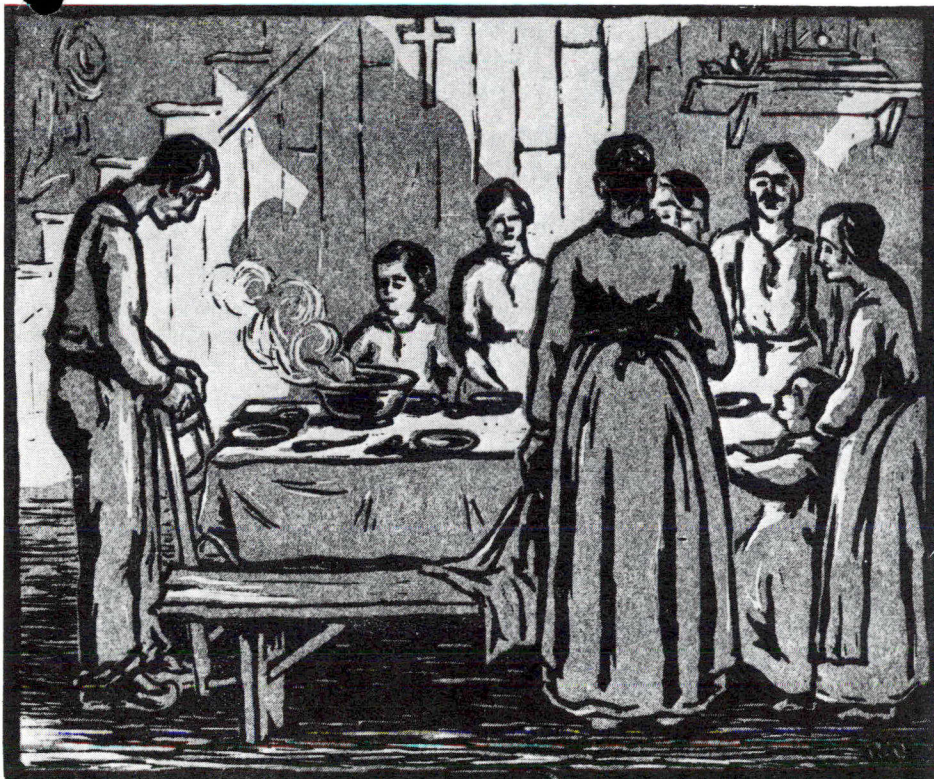
Duguay, R., Le Bénédicité, 1930. Gravure sur bois en gris-vert et noir. 16 x 19 cm (6-5/16 x 7-1/2 po).

L'une des douze nouvelles expositions itinérantes organisées dans le cadre du Programme national de la Galerie nationale du Canada fut inaugurée le 19 septembre dernier à Ottawa: Quarante gravures de Rodolphe Duguay.