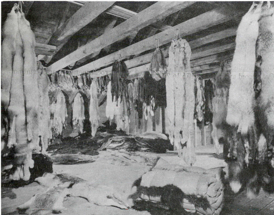
Le grenier où l'on entreposait les fourrures renferme encore la première presse à fouler les peaux utilisée par la Compagnie de la Baie d'Hudson. On peut