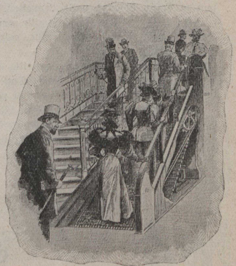
Un escalier qui marche.

viennent de la Nouvelle-Zélande et sont exposés à Londres. La dame qui les accompagne est leur mère.