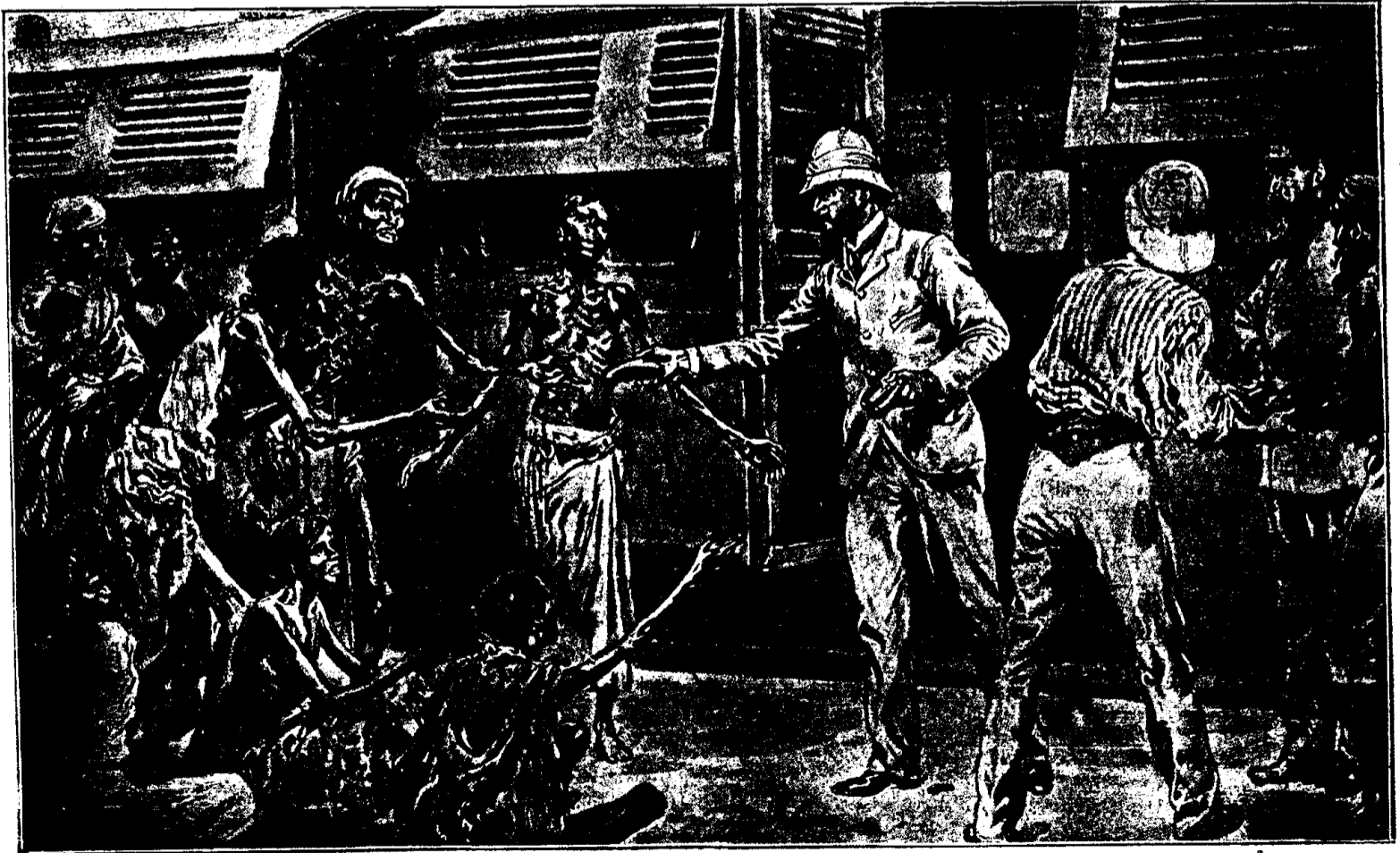
LA FAMINE AUX INDES