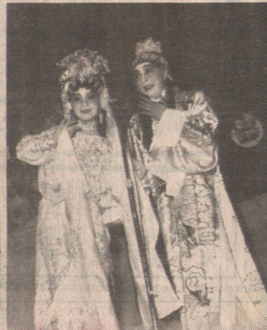
交通安全遊藝晚會。振華學藝員演出折子戲。