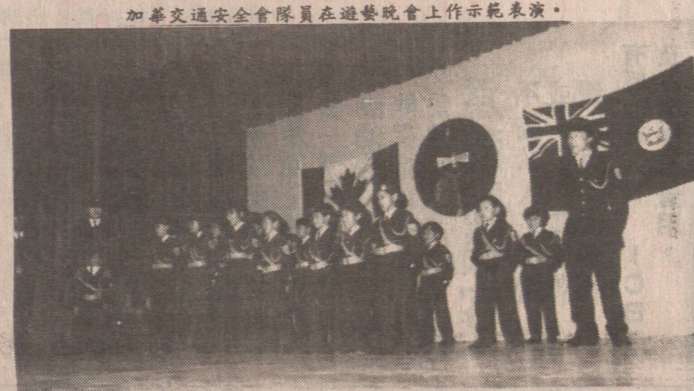
加華交通安全會隊員在遊藝晚會上作示範表演。