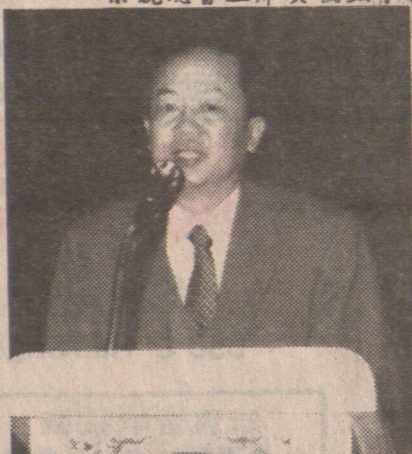
麟祥領事在伍胥山公所宴會時致詞。