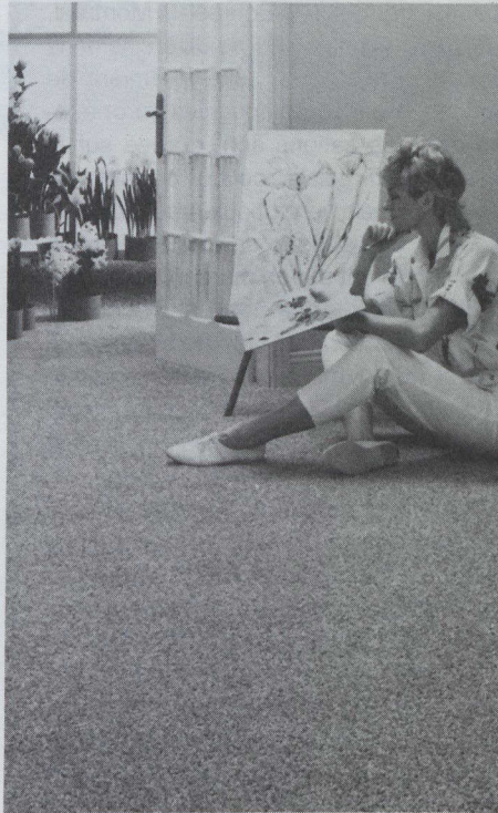
Coronet Carpets Inc. propose des moquettes bouclées de haute qualité disponibles dans une grande variété de coloris et de motifs géométriques.

Corporation, Burlington Canada, Kraus Carpet Mills et Coronet Carpets proposeront à Heimtextil des moquettes de grande qualité. Comme nouveaux produits, elles présenteront des moquettes bouclées ou coupées à tissage dense disponibles dans une grande variété de coloris et de motifs géométriques. L'entreprise Domco Industries, quant à elle, offrira des revêtements de sol en vinyle. Le spécialiste des tapis à impressions, Soreltext, présentera toute une gamme de tapis touffetés de diverses qualités. La compagnie Designer Classics, spécialisée dans les produits sur mesure, exposera ses tapis, tapisseries et carpettes réalisées à la main.