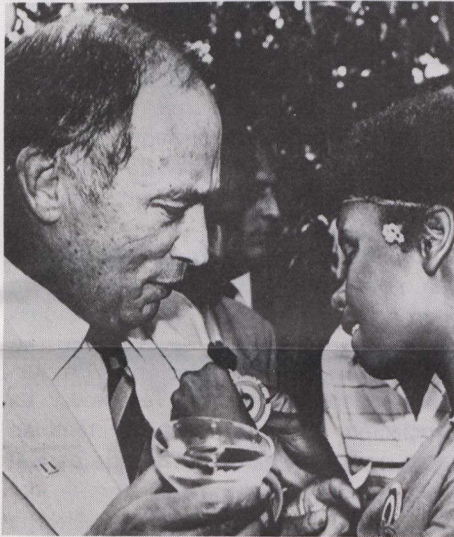
Una muchacha coloca una insignia en la solapa del Primer Ministro Pierre Trudeau durante la conferencia.

Jóvenes de 50 países se reunieron en Montreal este verano para debatir problemas mundiales.