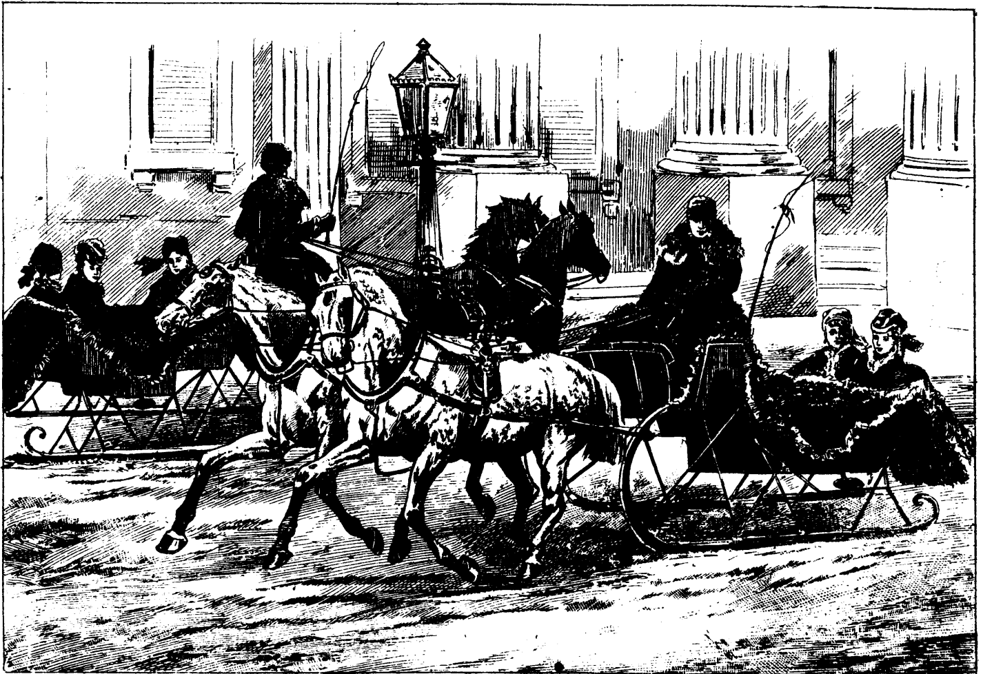
MONTRÉAL. — LA PLACE-D'ARMES UN SAMEDI APRÈS-MIDI

ABONNEMENTS : Six mois : $1.50. — Un an : $3.00