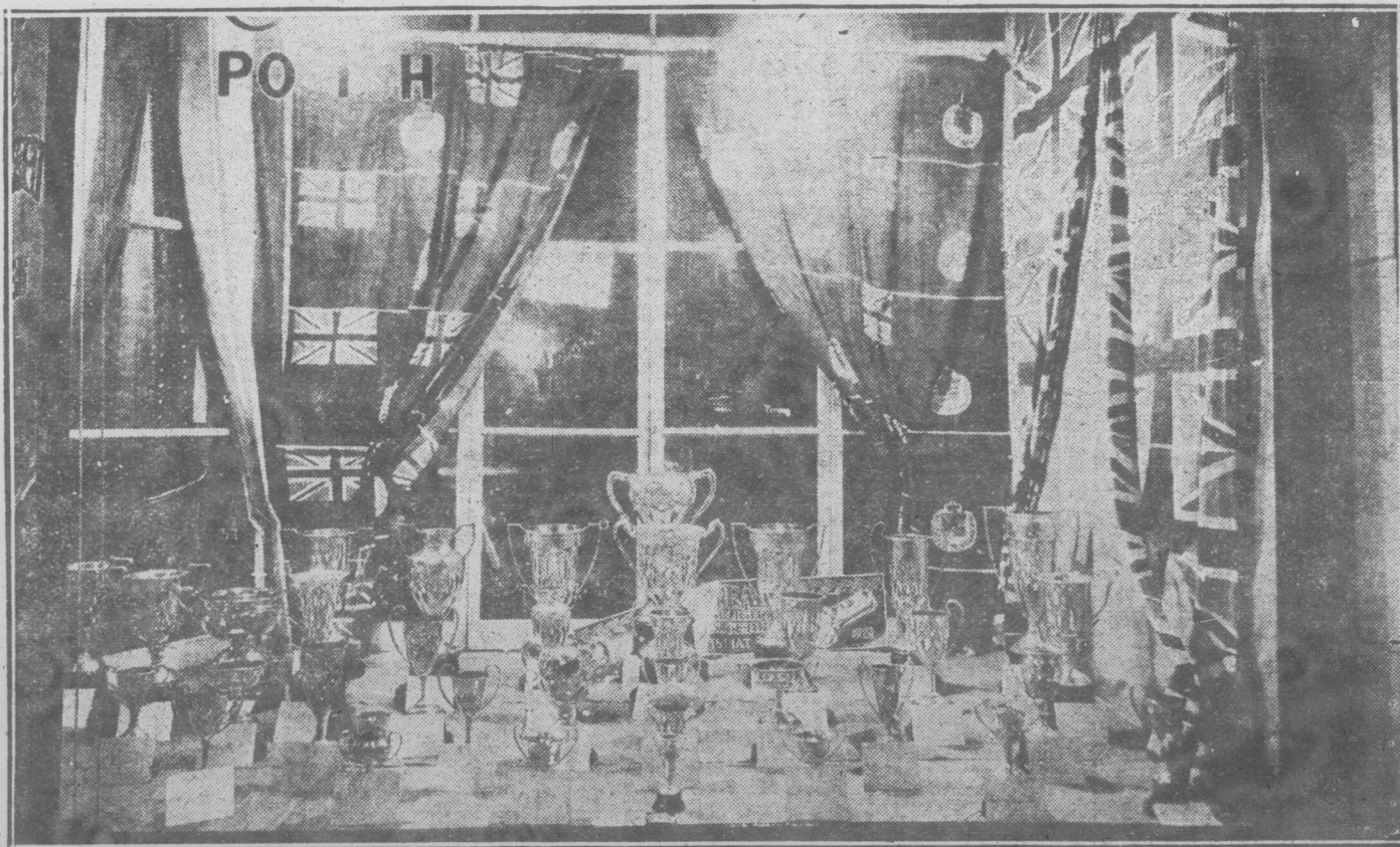
Coupes et Trophées offerts aux exposants à l'exposition avicole de Trois-Rivières, qui a remporté un si brillant succès.

Vita-Gland Laboratories 1051 Edifice Bohan, Toronto, Ont.