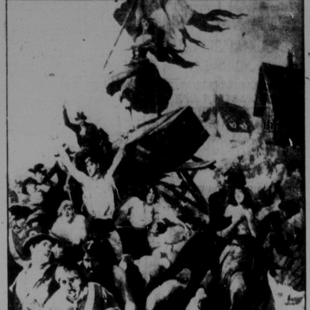
Сцена з наступу нуждарів на чолі з визвольним прапором.

Драма ця сценізована на тлі історичного твору французького письменника Віктора Гюго з наполеонських часів. Автор представляє невинне життя нуждарів наслідком вибагливого і російного життя здегенерованої французької шляхти. Зриваються ті нуждарі до революції, бо іншого виходу не бачуть. Борються на життя і смерть зі шляхтою, а радше з її військом і кінець кінців, на місце феодальної шляхти приходять до влади французька буржуазія, а працюючі маси осталися надал підвладними рабами.