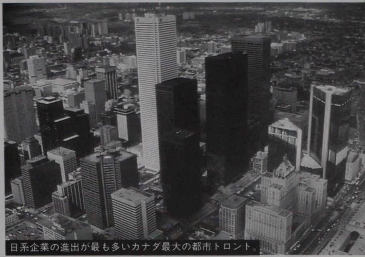
日系企業の進出が最も多いカナダ最大の都市トロント。