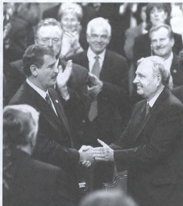
Le 25 octobre 2004 : Le premier ministre Paul Martin et le président du Mexique Vicente Fox prononcent un discours devant le Parlement.