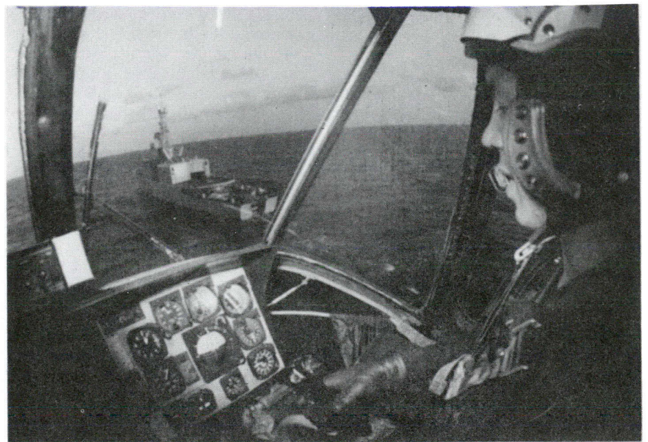
Un pilote d'hélicoptère se prépare à descendre sur le destroyer canadien Algonquin, dans les Caraïbes.